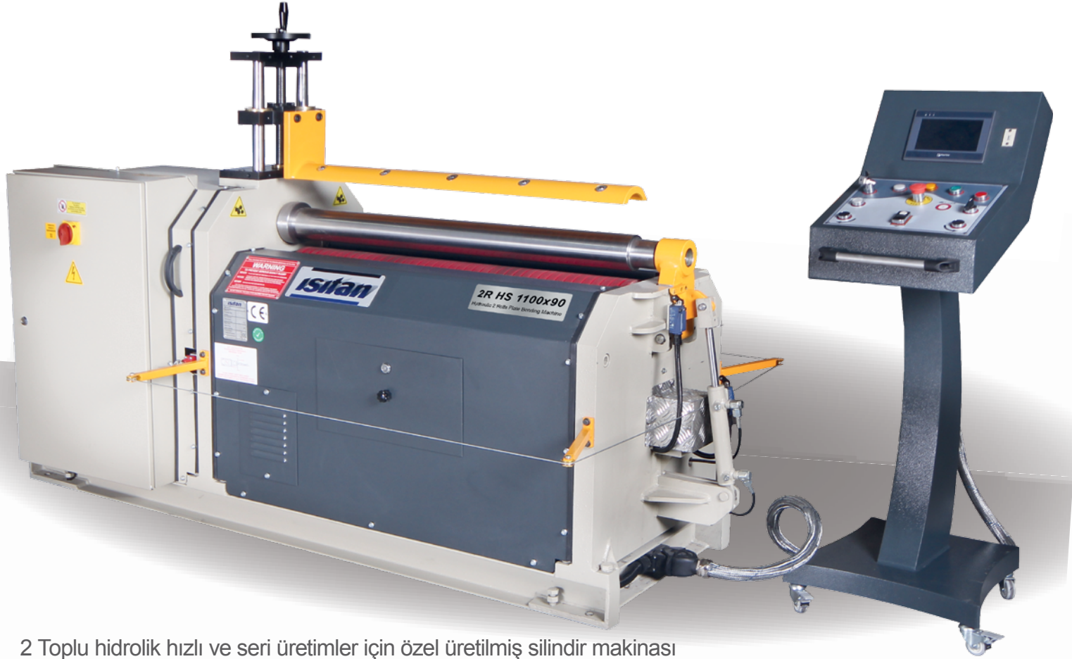
2 Toplu hidrolik hızlı ve seri üretimler için özel üretilmiş silindirik makinesi 2 Roll hydraulic type plate bending machine for fast and continuous production