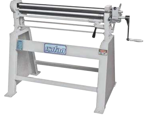
Model R 1050x56