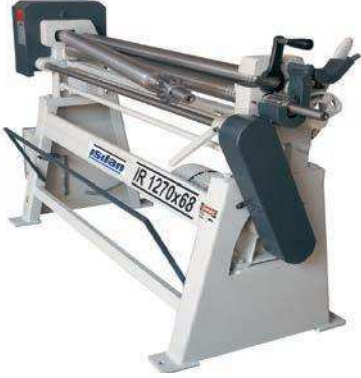
Standart Elle Açılabilen Sac Çıkarma Kafası Standard Manual Dropend