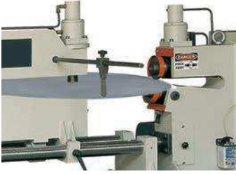
Hidrolik Kesme ve Sıkma Sistemi Hydraulic Clutch and cutting system