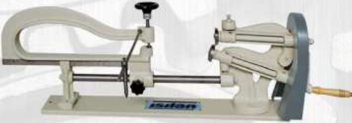
IDK-1 Manuel kollu Daire Kesme Makası ( iç çap pul çıkartamaz ) Manual Circular Cutting Shear ( can not cut inside diameters )