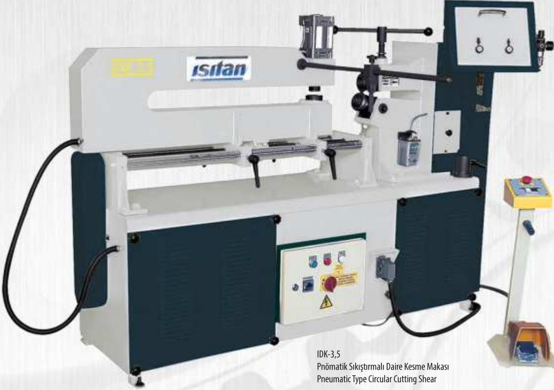
IDK-3,5 Prömatik Sıkıştırılmalı Daire Kesme Makası Pneumatic Type Circular Cutting Shear