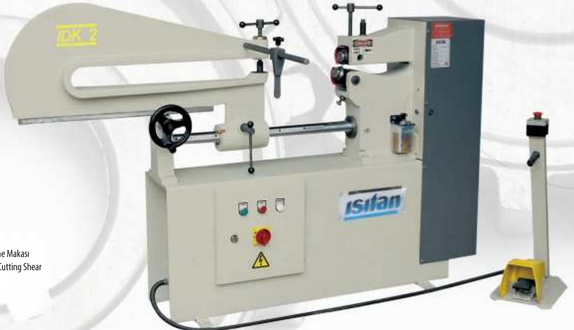
IDK-2 Motorlu Daire Kesme Makası Motorised Circular Cutting Shear