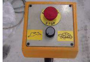
Opsiyonel kademesiz ayarlanabilir hız sistemi Optional variable speed system