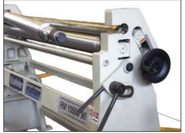
Standart Elle Açılabilen Sac Çıkarma Kafası Standard Manual Dropend