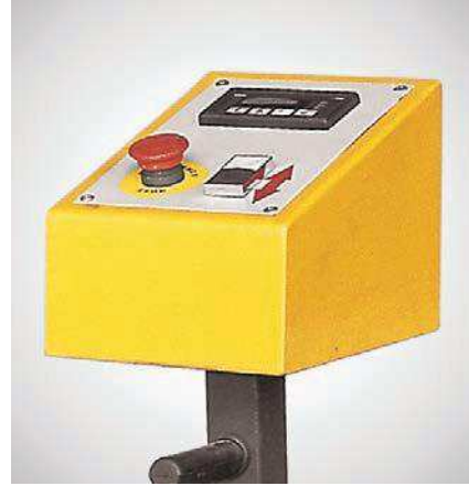
Opsiyonel dijitali kumanda paneli (sadece motorlu arka top ile uygulanabilir) Optional control panel with digital readout (only applicable with motorised back roll)